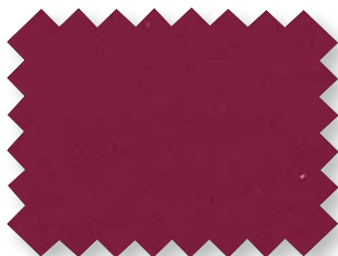
Lie de vin 530